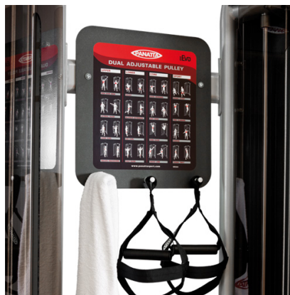
WALL - SMART VERSION

Attrezzo versatile e di facile uso consente di eseguire vari tipi di allenamento: functional training, preparazione atletica, riabilitazione e ginnastica posturale. Grazie alle regolazioni in altezza ed allo snodo free motion 360° si adatta a qualsiasi tipologia di utente.