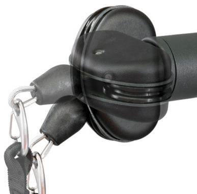
JOINT FREE MOTION 360°