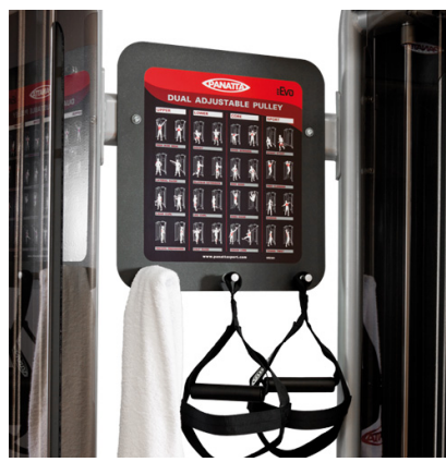
WALL - SMART VERSION

Attrezzo versatile e di facile uso consente di eseguire vari tipi di allenamento: functional training, preparazione atletica, riabilitazione e ginnastica posturale. Grazie alle regolazioni in altezza ed allo snodo free motion 360° si adatta a qualsiasi tipologia di utente.