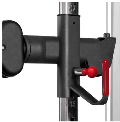
DYNAMIC REGULATION SYSTEM